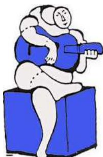
Wijkeraad Nieuw Waldeck