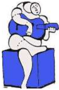
Wijkeraad Nieuw Waldeck