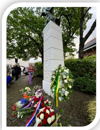
4 mei: Dodenherdenking