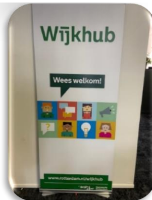
Poster voor informatiebus op de Loosduinse markt, waar men langs kan komen voor vragen of informatie.