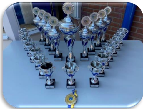
Jaarlijks voetbaltoernooi voor basisscholen in Loosduinen en gesteund door de Commissie Loosduinen.