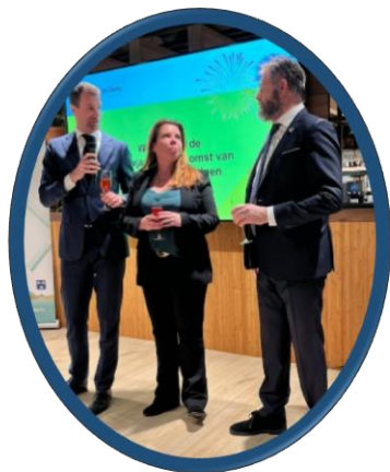
Bijeenkomst over de ontwikkeling Kijkduin-bad en het plan kust.