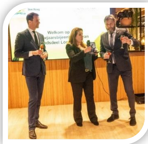
Nieuwjaarsreceptie 2024 Een toast op het nieuwe jaar