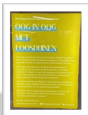
Een boekje gemaakt door het gemeentearchief met de geschiedenis van Loosduinen en Loosduiners die op de foto zijn gezet. In de tramtunnel hingen deze foto's.