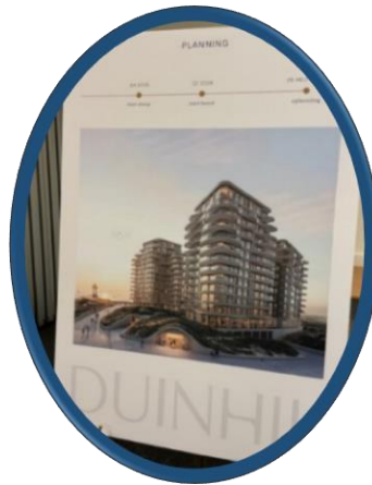
Nieuwbouwplan Duinhil op de plaats van hotel Atlantic.